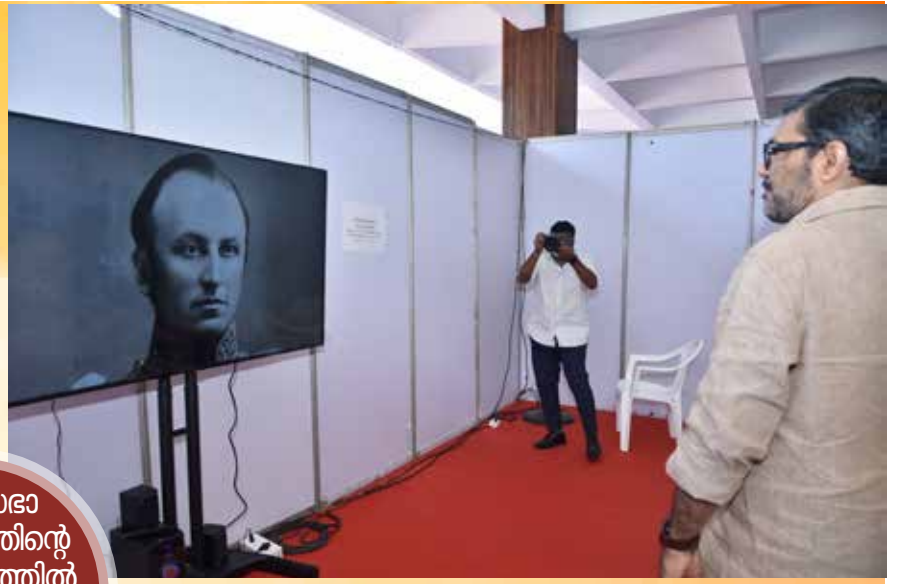
നിയമസഭാ മ്യൂസിയത്തിന്റെ ആഭിമുഖ്യത്തിൽ നടത്തിയ പ്രദർശനം