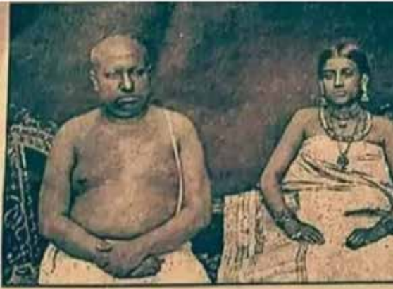
കേരളത്തിലെ ആദ്യ ഫോട്ടോ: (1860) ആയില്യം തിരുനാൾ മഹാരാജാവു, രാജപത്നിയ

ഈ ഫോട്ടോയെടുക്കാൻ സായിപ്പ് കൈപ്പിയത് 2001 പൊൻപണവും 400 ക്വിന്റൽ കുരുമുളകും