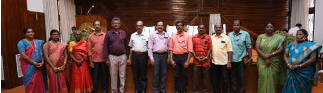
വിരമിച്ച ജീവനക്കാർ നിയമസഭാ സെക്രട്ടറി, സ്പെഷ്യൽ സെക്രട്ടറി, സ്പീക്കറുടെ പ്രൈവറ്റ് സെക്രട്ടറി എന്നിവർക്കൊപ്പം