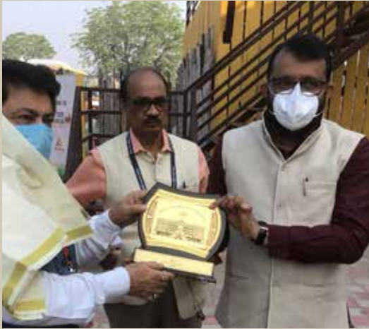
ഗുജറാത്ത് സ്പീക്കർ രാജേന്ദ്രത്രിവേദിക്ക് സ്പീക്കർ പി. ശ്രീരാമകൃഷ്ണൻ ഉപഹാരം നൽകുന്നു

ഇന്ത്യൻ ജനാധിപത്യത്തിന്റെ യാത്രയിൽ സ്ഥാപനങ്ങൾ തമ്മിൽ പലപ്പോഴും അഭിപ്രായ വ്യത്യാസങ്ങളുണ്ടായിട്ടുണ്ടെങ്കിലും അവയ്ക്ക് ഭരണഘടനയുടെ ശക്തമായ അടിത്തറയിലൂന്നിയ മാർഗ്ഗങ്ങളിലൂടെ പരിഹാരം കണ്ടെത്തിയിട്ടുണ്ടെന്ന് ലോക്സഭാ സ്പീക്കർ ഓം ബിർജ പ്രസ്താവിച്ചു. ഇന്ത്യൻ സംസ്കാരത്തിന്റെ അടിസ്ഥാനമായ ബഹുസ്വരത്വ് ഭിന്നതകളെയും അഭിപ്രായ വ്യത്യാസങ്ങളെയും ഉൾക്കൊള്ളാൻ സാധിക്കുമെന്നും അപ്രകാരമുള്ള ചർച്ചകളിലൂടെ സമൂഹം ചലനാത്മകമാകുമെന്നും ലോക്സഭയിലെ കോൺഗ്രസ്സ് നേതാവ് അധീർ രഞ്ജൻ ചൗധരി പറഞ്ഞു. നിയമനിർമ്മാണ സഭകളിൽ പലപ്പോഴും സമ്മേളനം തടസ്സപ്പെടുത്തിയുള്ള പ്രതിഷേധങ്ങളെക്കുറിച്ച് ആത്മപരിശോധന നടത്താൻ സഭാഭ്യക്ഷന്മാരും ബന്ധപ്പെട്ട കക്ഷികളും