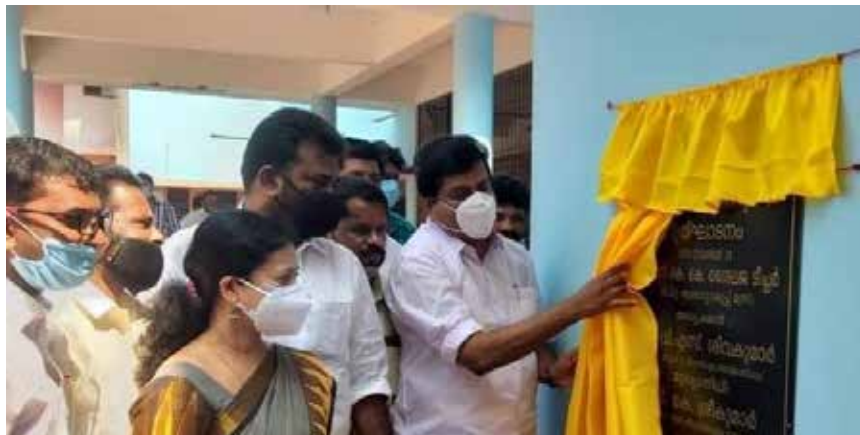
കേരളത്തിൽ കിടത്തി ചികിത്സയുള്ള ആദ്യത്തെ സിദ്ധ ആശുപത്രിയായി വള്ളക്കടവിൽ നിർമ്മിച്ച കെട്ടിടത്തിന്റെ ഉദ്ഘാടനചടങ്ങിൽ എം.എൽ.എ. ശിലാഫലകം അനാച്ഛാദനം ചെയ്യുന്നു.