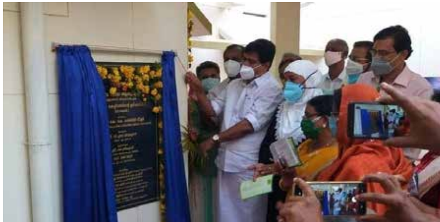
പുതു ആശുപത്രി കുടുംബാരോഗ്യകേന്ദ്രമായി ഉയർത്തിയത് പ്രഖ്യാപിച്ചുകൊണ്ടുള്ള ശിലാഫലകം എം.എൽ.എ. ഉദ്ഘാടനം ചെയ്യുന്നു.